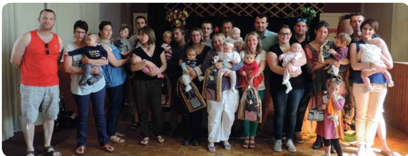
Les bébés et leurs parents.