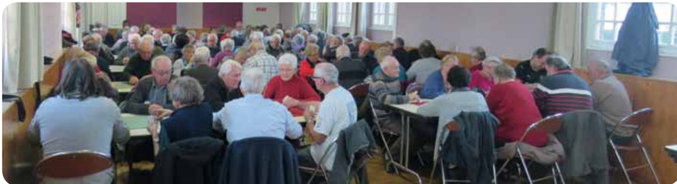
Concours de belote du 22 novembre 2017.