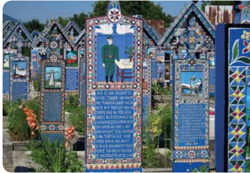
Cimetière de Sapanta.

espaces verts et des allées piétonnes, l'eau potable est arrivée dans chaque maison et apporte un confort supplémentaire. Nous sommes allés à la rencontre de nos amis de Marpod qui espèrent que l'on vienne plus nombreux, car pour eux le coût du transport reste un handicap.