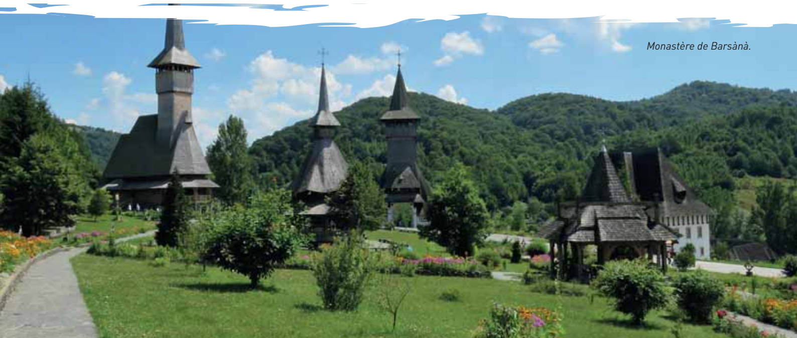
Monastère de Barsànà.