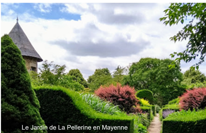
Le Jardin de La Pellerine en Mayenne